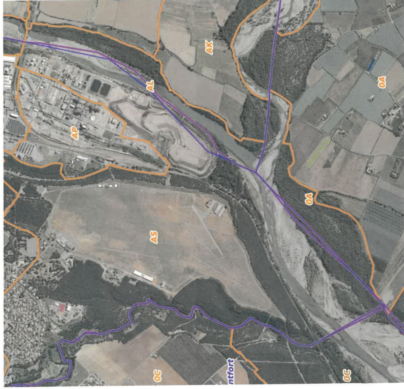
Illustration 3: Vue aérienne des parcelles concernées par l'interdiction d'usage des eaux souterraines. Détail des parcelles dans l'illustration suivante.