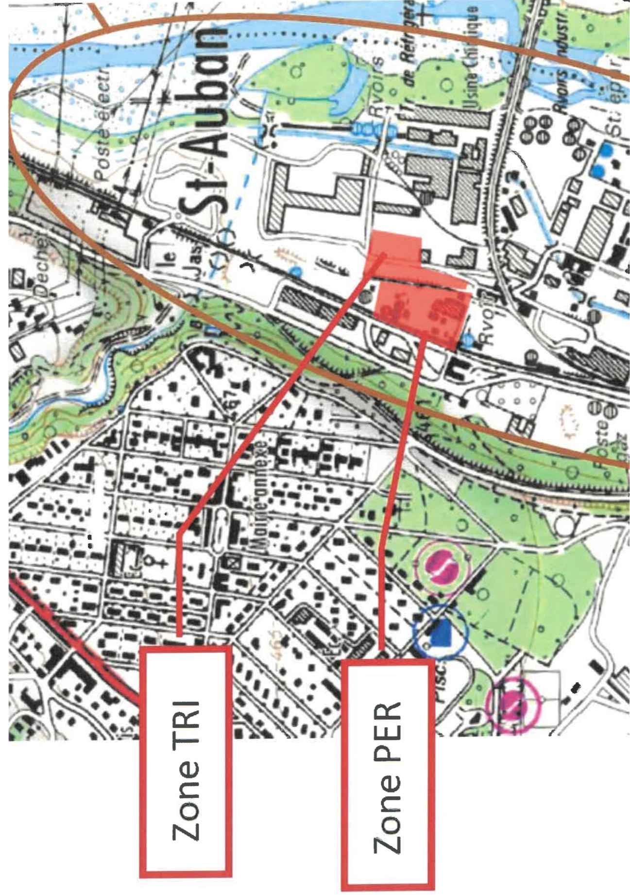
Illustration 1: Plan de situation des zones TRI et PER